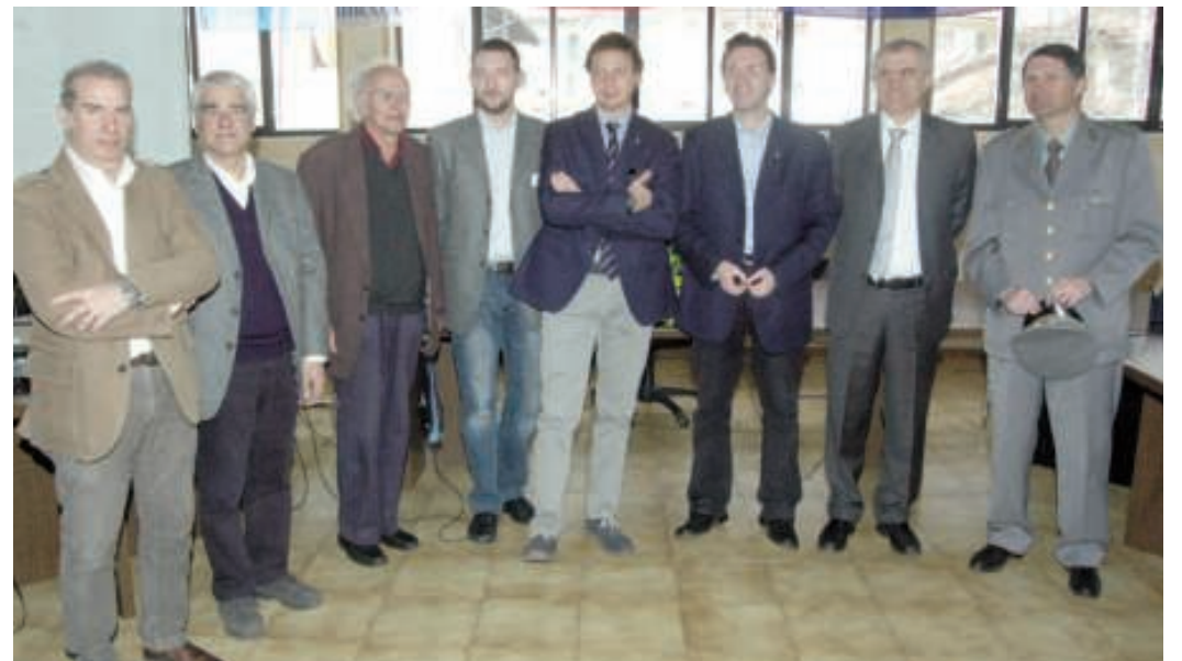
Foto di gruppo durante l'inaugurazione, sabato mattina, del Centro di Documentazione dei Monti Pelati

"Il Centro Didattico - ha detto - è stato fortemente voluto dalla Provincia, ma è stato possibile realizzarlo grazie alla disponibilità dell'amministrazione comunale che ha messo a disposizione i locali dove abitualmente si svolgono anche le sedute del consiglio co-