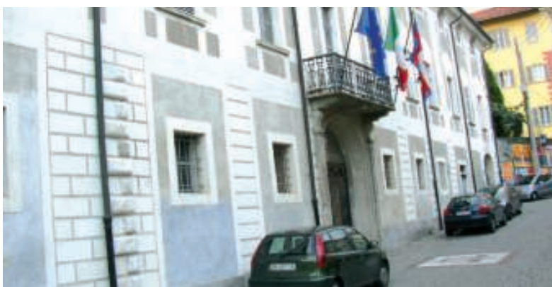
L'ingresso del tribunale di Ivrea