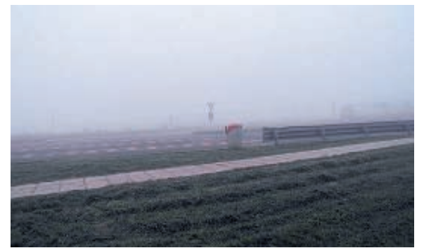
Il parcheggio dei camion dell'area di servizio di Villarboit

VILLARBOIT (tri) E' ancora giallo sull'uomo trovato morto alla stazione di servizio di Villarboit venerdì 19 dicembre all'ora di pranzo. Sulla vicenda sono in corso le indagini della Polstrada di Novara Est. Il caso è di competenza della Procura della Repubblica presso il Tribunale di Vercelli. Non si esclude l'ipotesi di decesso per cause naturali.